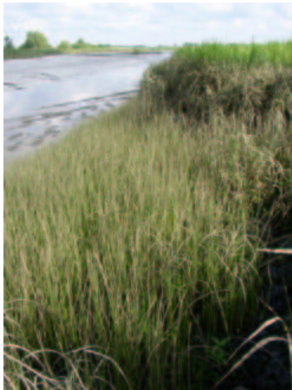
Tabelle 6: Dreikantsimsen-Strandsimsen-Röhrichts ( Scirpetum triquetri-maritimi )

Als Biotoptyp ist der tiderhythmisch überflutete Bestand dem Flußwatt-Röhricht (FWR) zu zuordnen.