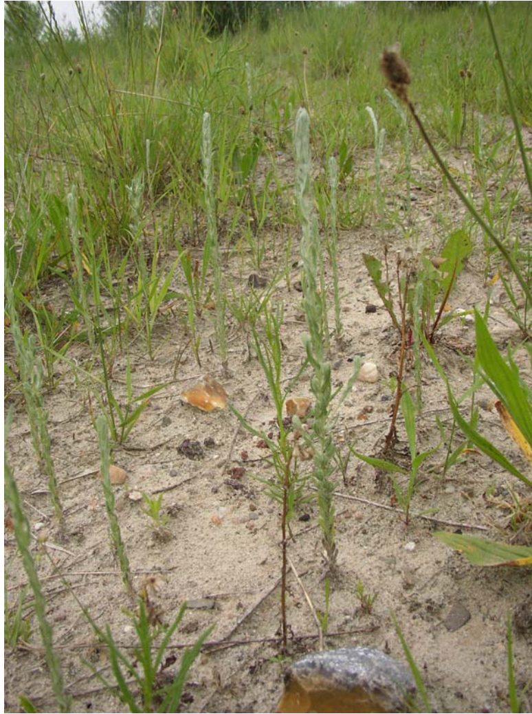
Foto 1: Sand-Magerrasen mit Acker-Filzkraut auf der Rönnebecker-Düne