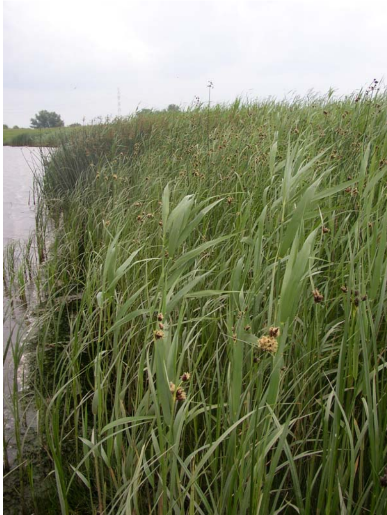
Foto 3: Strand-Simsen- und Salz-Teichsimsenröhricht am Südufer des Tidegewässers